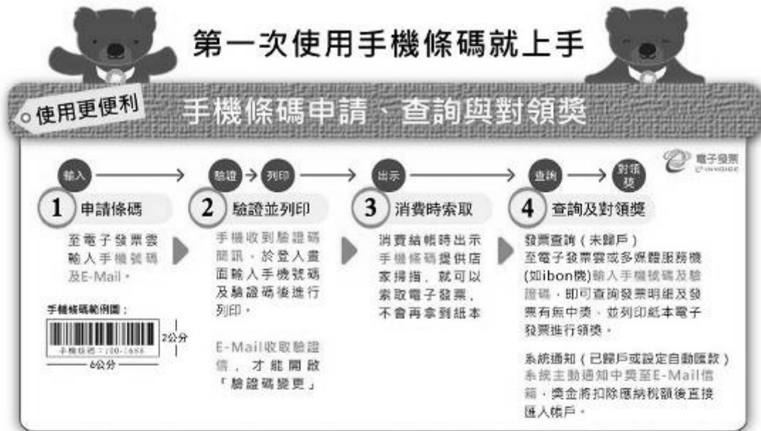
圖 1：手機條碼聰明包